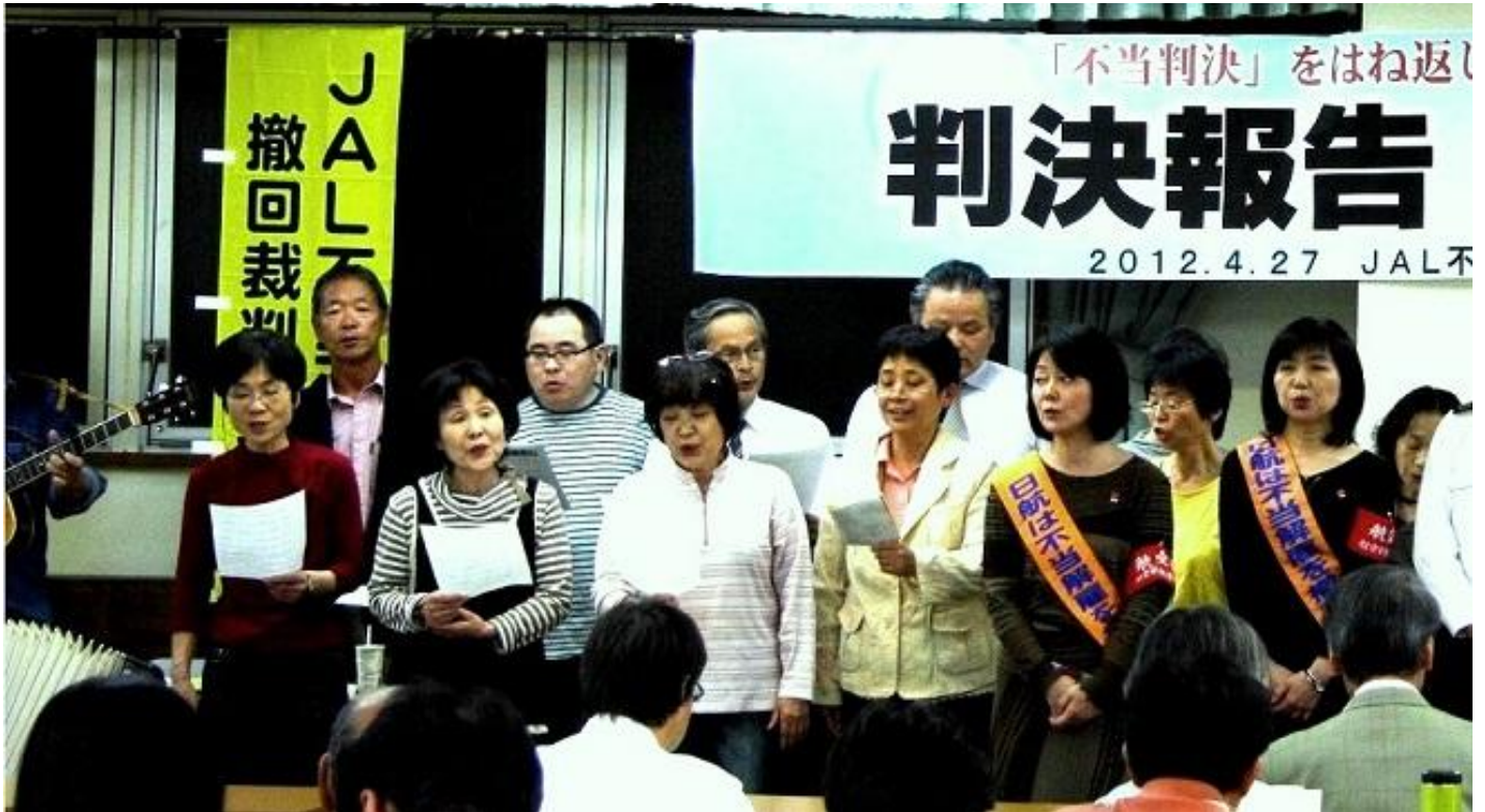
控訴審で必ず勝利し職場復帰を果たすぞと、支援の仲間と原告が一緒になって「あの空へ帰ろう」を合唱