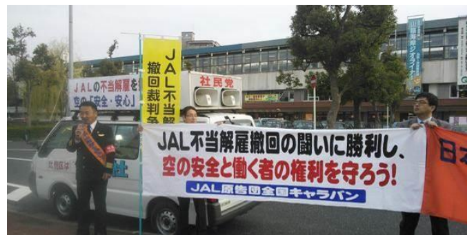
【写真】参加者5名で鳥取駅前での宣伝行動

街宣後に「詳しく聞きたい」という男性に、破たんの原因や株式の上場などを説明しました。