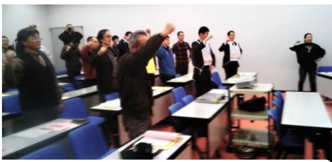
【写真】夕方からは、りとりぎん文化会館で鳥取集会