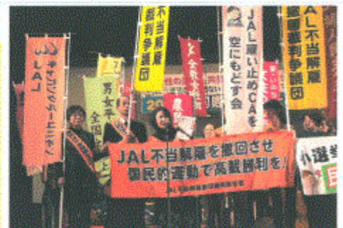
2013年国際女性デー中央大会 交流の広場で(3月8日)

◇会場 文京シビックホール(文京区春日1-16-21) ◇開場:18:00 開会:18:30