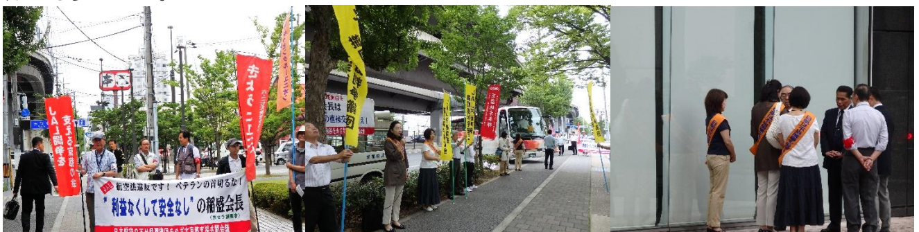
(「儲けなくして安全なし」の稲盛イズム) (バスで参加する株主への宣伝)

私は、「① 岡崎の京都市美術館を京セラが50年間・50億円で買い取るという問題で 、市民やなかんずく内外の芸術家から反対の意見が出て、輦蹙をかい、まるで札束で人の頬をたたきたくやうで私たちは株主として格好悪い。是正する考えはないか。②京セラの事業：自然再生エネルギーの普及・太陽光パネルを広めるためにも、6年前福島第一原発事故を引き起こしてしままだに原因の燃料もロボットでさえ見れていない 危険な原子力発電所の問題について 、教育宣伝を会社としても行う必要があると思うがどうか」という二点の質問を行った。①については特にうなずく株主も多かった。